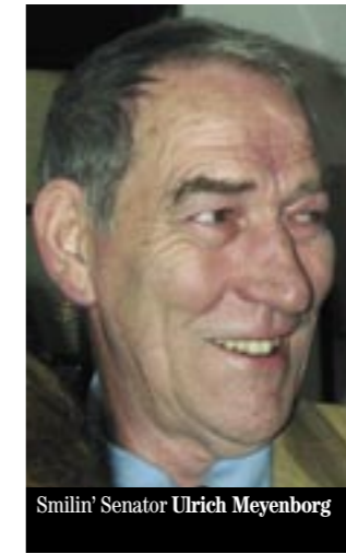
Smilin' Senator Ulrich Meyenborg