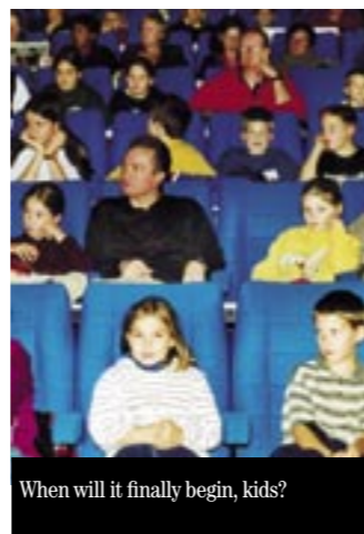
When will it finally begin, kids?