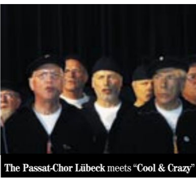
The Passat-Chor Lübeck meets "Cool & Crazy"