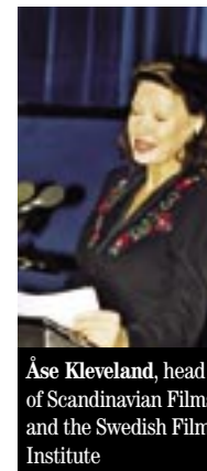
Åse Kleveland, head of Scandinavian Films and the Swedish Film Institute