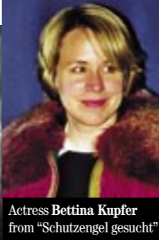
Actress Bettina Kupfer from "Schutzengel gesucht"