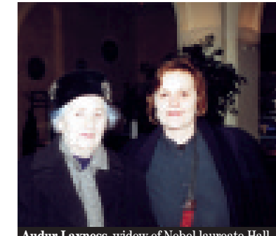
Audur Laxness , widow of Nobel laureate Hall-dor Laxness and mother of Gudny Halldórsdóttir (right), director of "Honour of the House", based on one of Laxness' short stories