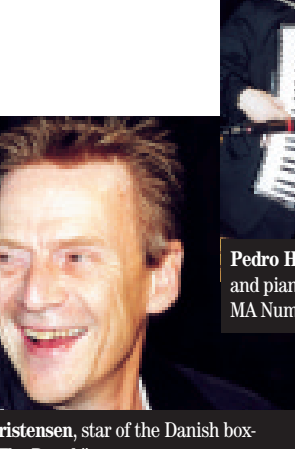
Jesper Christensen , star of the Danish box-office hit "The Bench"