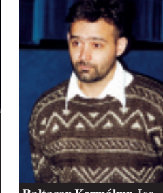
Baltasar Kormákur , Icelandic director of "101 Reykjavik"